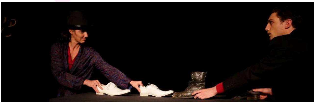
Ici, la rencontre entre Arthur Rimbaud et Paul Verlaine