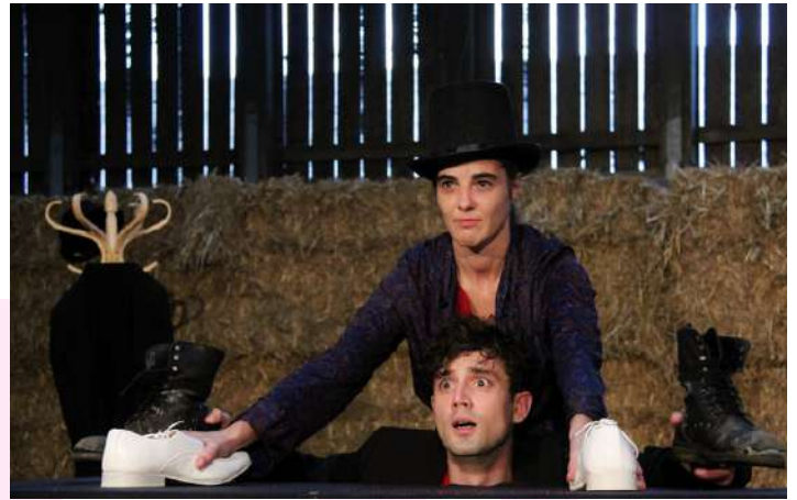
Arthur à Vendre, 2016 Tout public, 45 minutes Théâtres d'objets Coproduction les Enfants Sauvages - FMTM