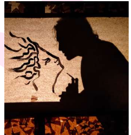
Orphée Miniature, 2022 Tout public - 50 mn Théâtre et marionnettes Coproduction les Enfants Sauvages - Le Périscope de Nîmes - Le Théâtre Jean Arp de Clamart - Le Festival Mondial des Théâtres de Marionnettes de Charleville- Mézières - L'Entre-Pont de Nice - l'Espace Périphérique de Paris - L'UsinoTopie de Villemur-sur-Tarn - La Fabrique Mimont Cannes - La Scène 55 de Mougins.