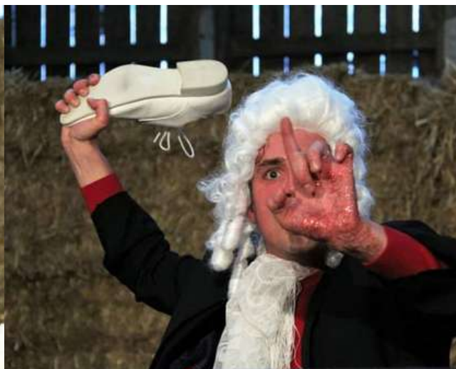
Avant-première - Festival Sème la Culture, 2016 Ici, le juge de l'affaire Verlaine