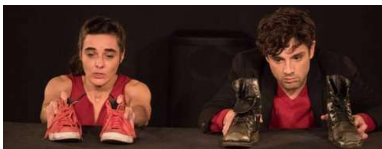
Ici, Ernest Delahaye, le meilleur ami d'Arthur, et lui-même

Nous partons de sa petite enfance, jusqu'à sa mort, à Marseille, en 1875, date de son grand départ. Le spectacle est ponctué d'extraits originaux de ses poèmes, mais aussi d'archives de lettres, d'articles de journaux, et de comptes-rendus médico-judiciaires, qui donnent à entendre le décalage du jeune Arthur avec son époque.