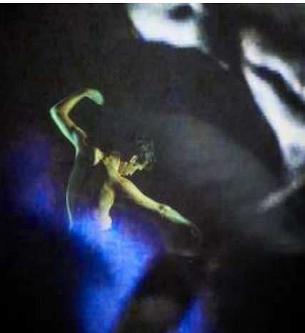
Choisir l'écume, 2017 Tout public - 65 minutes Théâtre hybride Coproduction les Enfants Sauvages - Th. Victor Hugo de Bagneux - Espace Périphérique de Paris - Th. Louis Juvet de Rethel - Féés d'Hiver - l'Hectare de Vendôme, TCM...