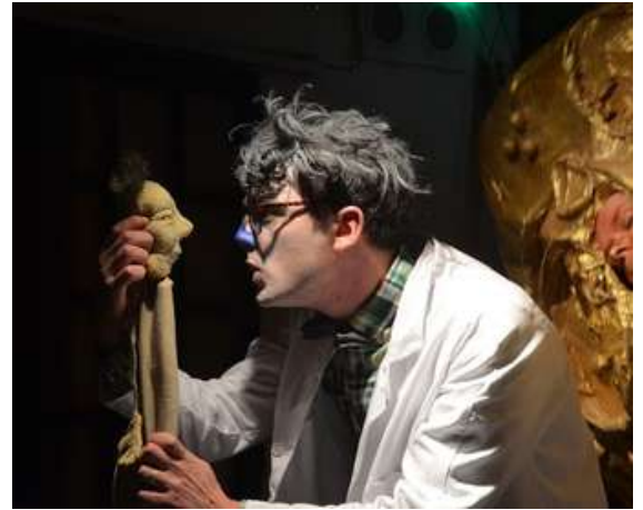
La Petite Planète, 2014 Jeune public - 20 mn Marionnette - conte Coproduction les Enfants Sauvages - FMTM