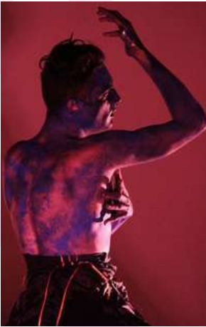
Pop-Hibiscus, 2014 Performance chorégraphique. Coproduction les Enfants Sauvages - Nuit Blanche