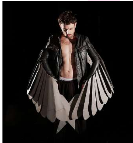
Sauroctone, 2019 Performance - 25 minutes Issue du travail autour de Game Over