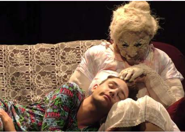
Nonna & Escobar, 2015 Jeune public - 50 minutes Marionnette - mime Coproduction les Enfants Sauvages - FMTM