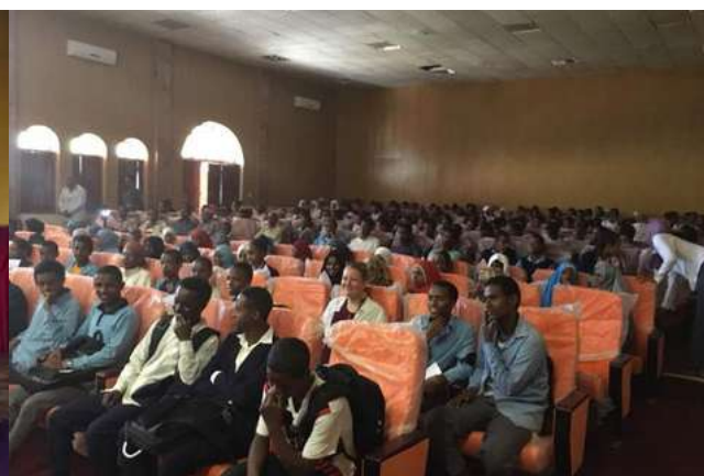
Tournée Éthiopienne - 2017 Alliance Française Addis Abeba