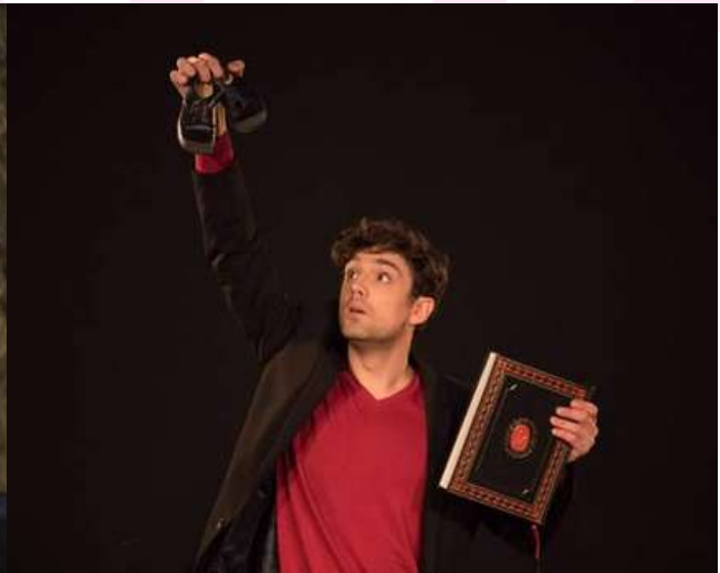
Bateau des Fous - FMTM off, 2017 Ici, Rimbaud grandit en lisant Hugo. Dans sa lettre, la Mère Rimbaud écrit Hugo avec un "t"